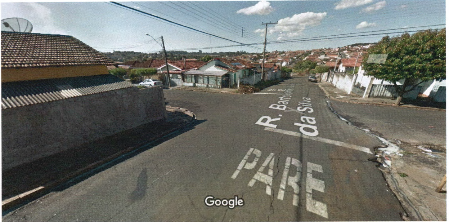
Captura da imagem: jun 2011