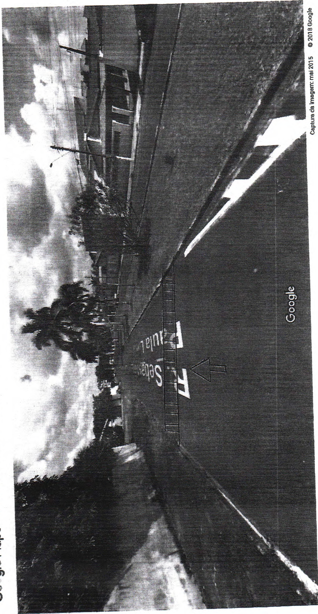
Captura da imagem: mai 2015