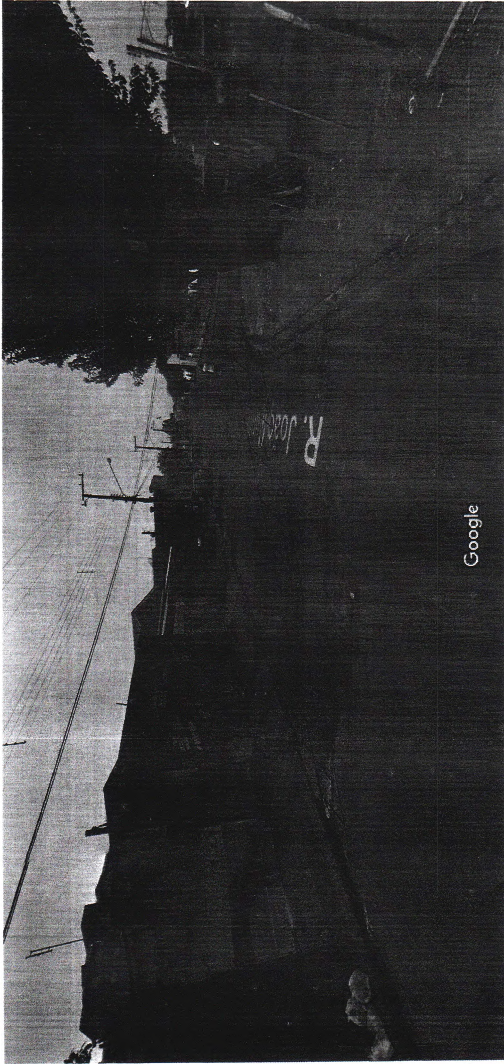
Captura da imagem: jul 2011 © 2018 Google

FAVOR FAZER UMA CHAMADA EM DIACRÍTICA PARA EVITAR IMUNIZAÇÃO NA CASA DE BRASÃO